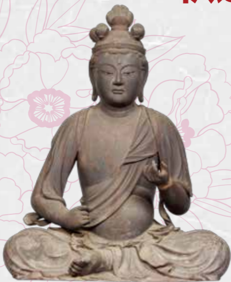
文殊菩薩坐像(神奈川・極楽寺)