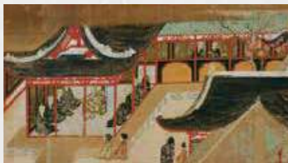
重要文化財 東征伝絵巻(巻第一・部分)(奈良・唐招提寺) ※前期・後期で巻き替え