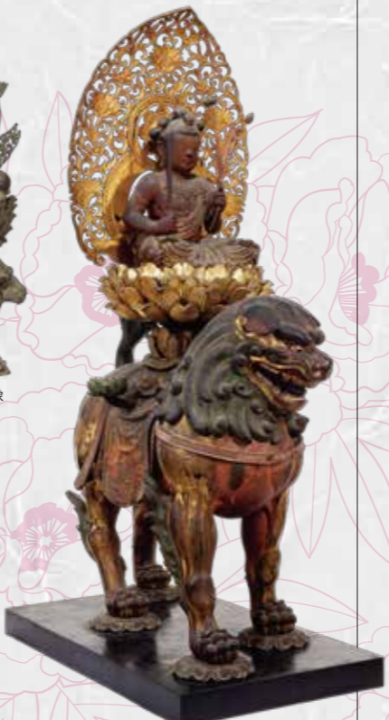
重要文化財 文殊菩薩騎獅像(奈良・般若寺) ※展示期間(7/26-8/11)