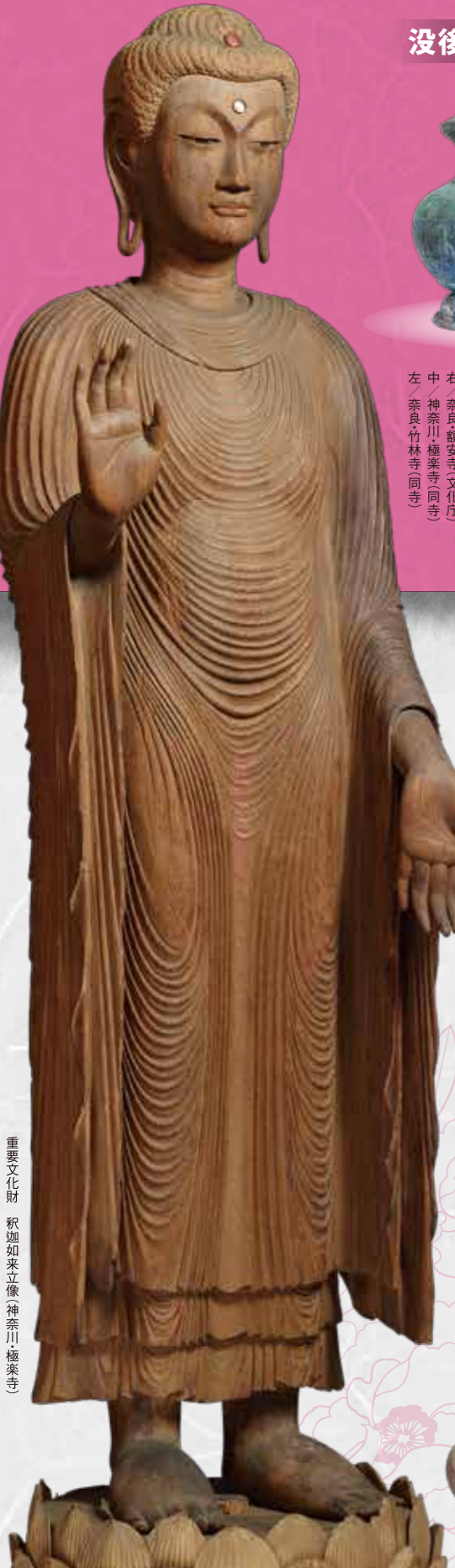
重要文化財 釈迦如来立像(神奈川・極楽寺)