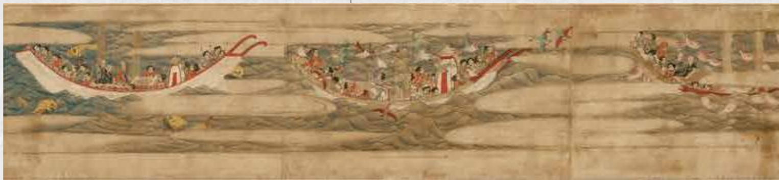
重要文化財 東征伝絵巻(巻第三部分) (奈良・唐招提寺) ※前期 後期で巻き替え