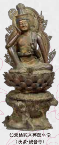
如意輪観音菩薩坐像 (茨城・観音寺)