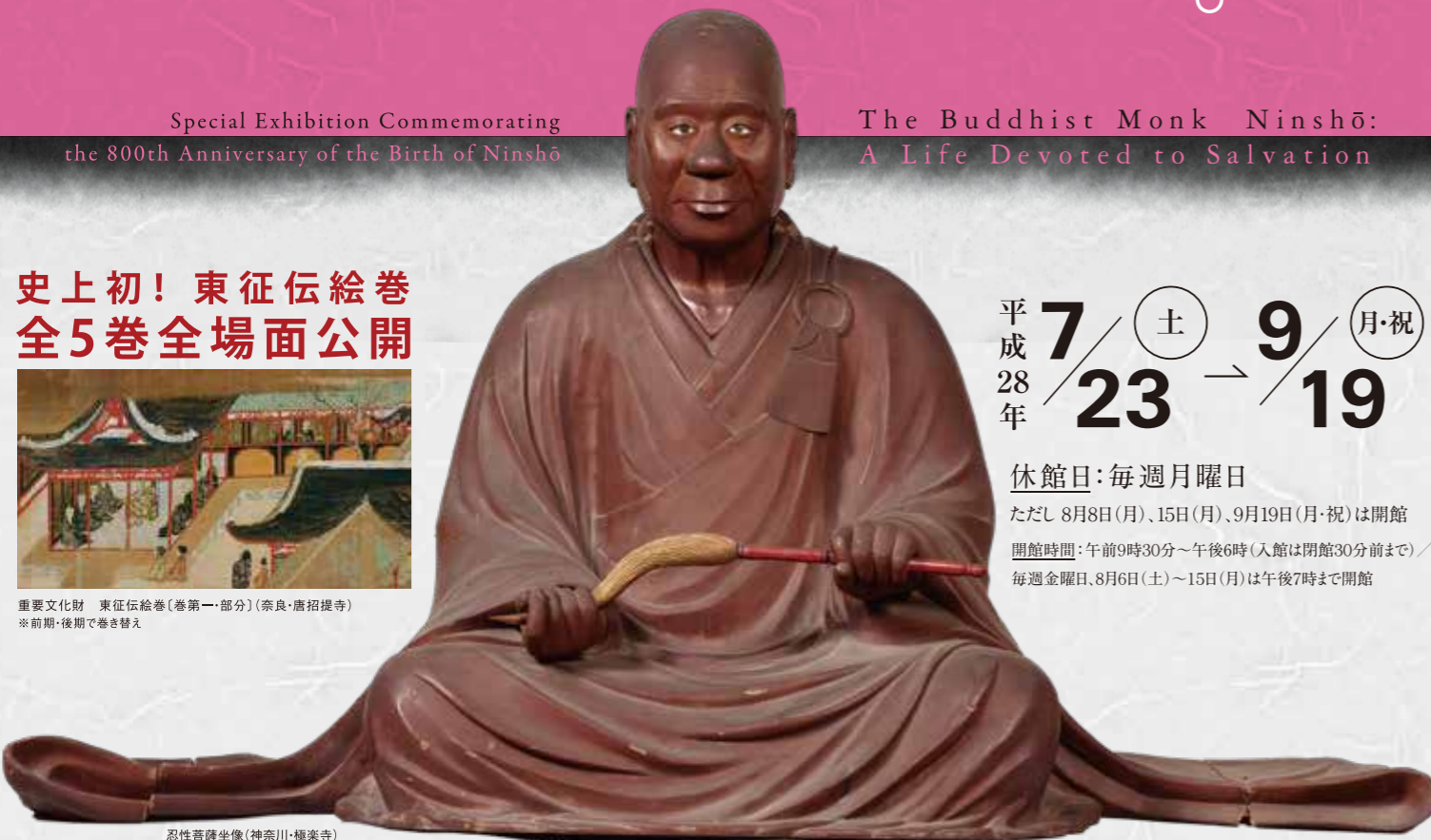
忍性菩薩坐像(神奈川・極楽寺)