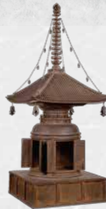
国宝 鉄宝塔(奈良・西大寺)