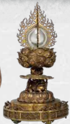
重要文化財 金銅火焰宝珠形舍利容器 (奈良・海龍王寺)