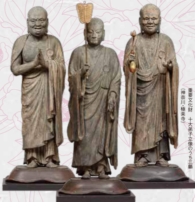
重要文化財 十大弟子立像のうち三軀 (神奈川・極楽寺)