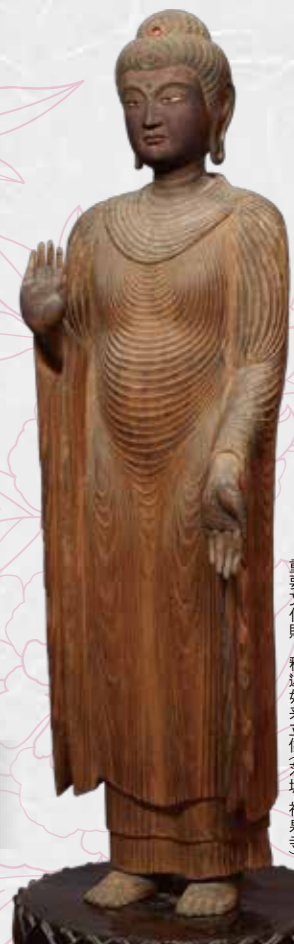
重要文化財 釈迦如来立像(茨城・福泉寺)