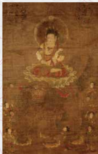
重要文化財 文殊菩薩騎獅像(奈良・西大寺) ※前期(7/23-8/21)展示