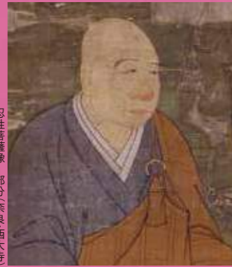
忍性菩薩像 部分奈良・西大寺 ※後期(8/23-9/19)展示

忍性生誕八〇〇年を機縁に、ゆかりの名宝・文化財を全国から一堂に集め、その生涯と偉業を偲ぶ特別展を開催いたします。忍性の生涯はまさに「興法利生」(仏法の発展と生命あるもののために尽くす)を極めたものでした。本展では、そうした忍性の心の背景にも目を配り、二〇〇件以上の多様な名宝、関連遺品を時代順に紹介しています。